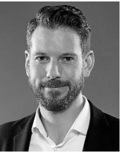
Director Agile Coaching fable+